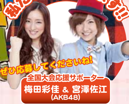
ぜひ応募してくださいね! 全国大会応援サポーター 梅田彩佳 & 宮澤佐江 (AKB48)